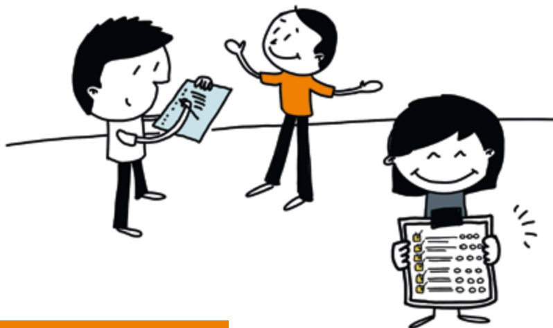
1. Behoeften en verhalen