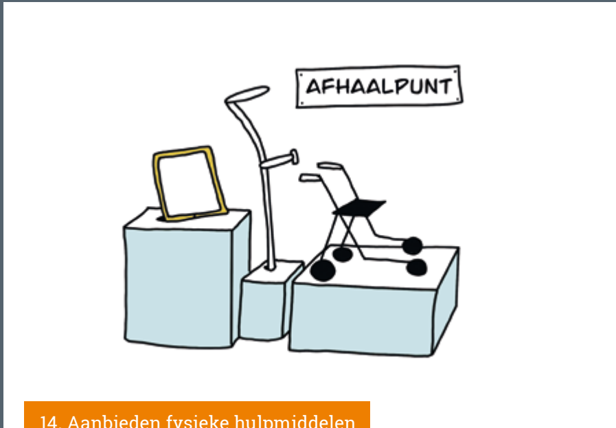
14. Aanbieden fysieke hulpmiddelen