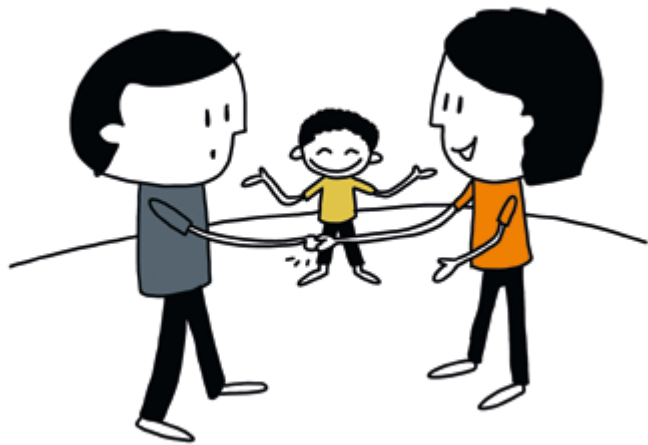
9. Buurt- en conflictbemiddeling