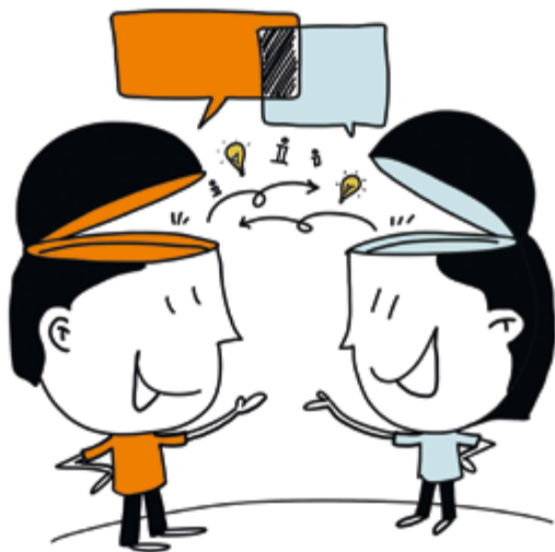
18. Debat en dialoog