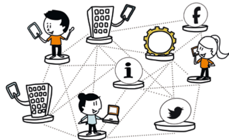
8. Infopunt, digitaal platform en community manager