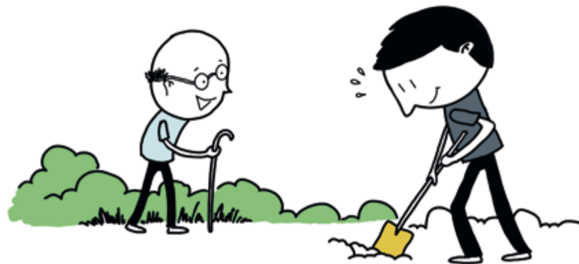
4. Burenhulp en praktische hulpdienst