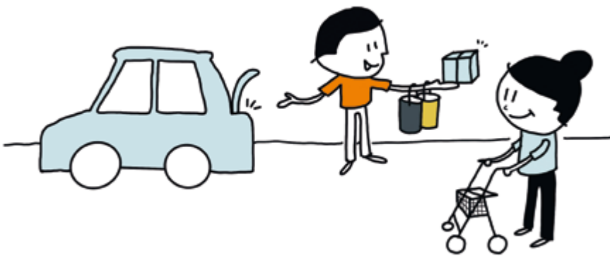
10. Kleinschalig vervoer