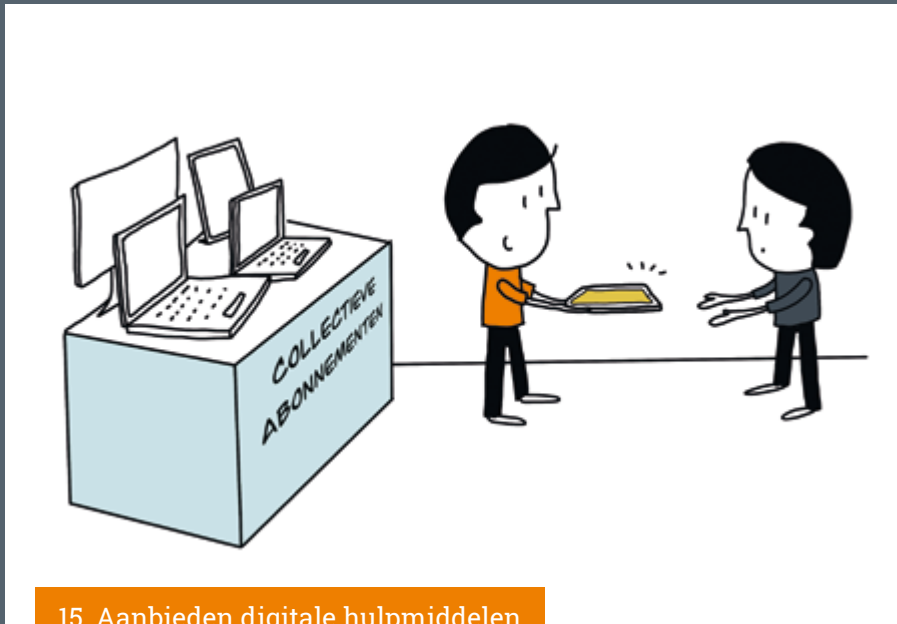
15. Aanbieden digitale hulpmiddelen