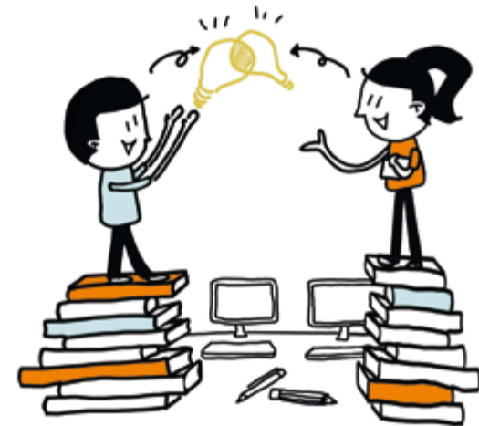
7. Leer- en werkplekken